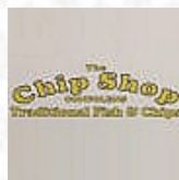
Chip Shop main image