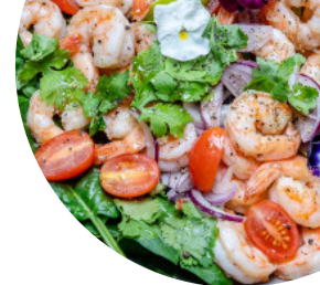
Table - Bruno Verjus