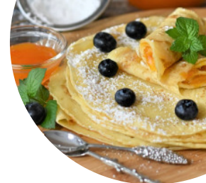
Table Des Lodges

Quartier Isertan, Pralognan-la-Vanoise, France